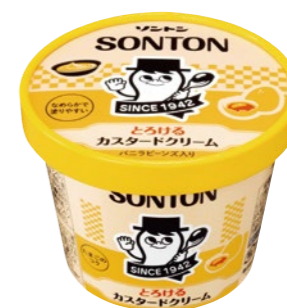
とろけるカスタードクリーム