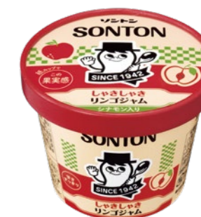
しゃきしゃきリンゴジャム