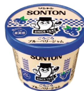
ごろごろブルーベリージャム