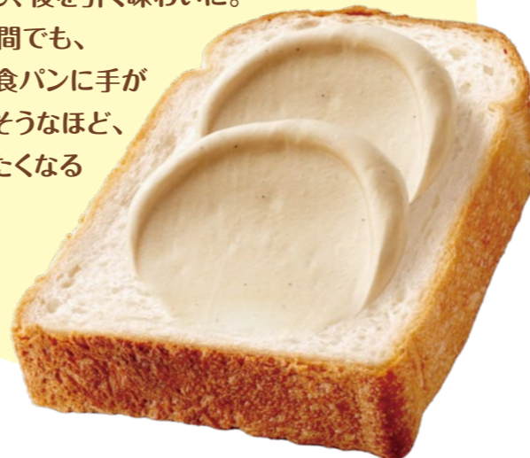
※発酵バターパウダー使用

キャラメルの香ばしさに発酵バター※の コクをプラスし、後を引く味わいに。 忙しい朝の時間でも、 ついもう一枚食パンに手が 伸びてしまいそうなほど、 たっぷり塗りたいくなる クリームです。