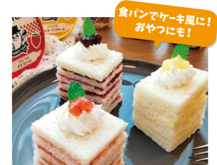
食パンでケーキ風に！ おやつにも！