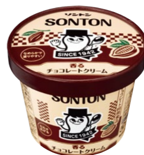
香るチョコレートクリーム