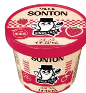
つぶつぶイチゴジャム