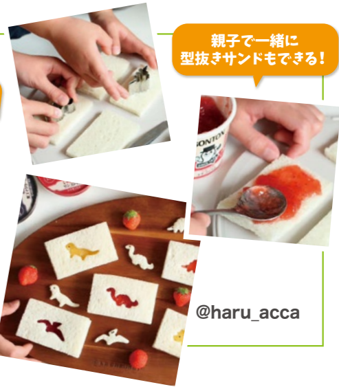
親子と一緒に 型抜きサンドもできる！