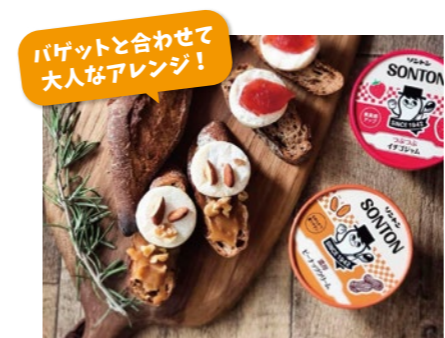
バゲットに合わせて 大人なアレンジ！