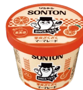
果皮ざくざくマーメレード