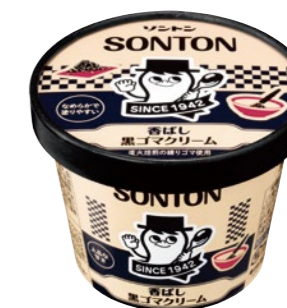
香ばし黒ゴマクリーム