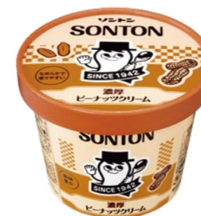
濃厚ピーナツクリーム